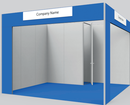
2 lati aperti 2 sides open